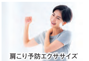
肩こり予防エクササイズ