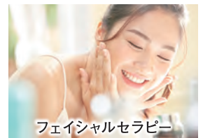
フェイシャルセラピー