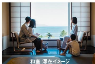
和室 滞在イメージ