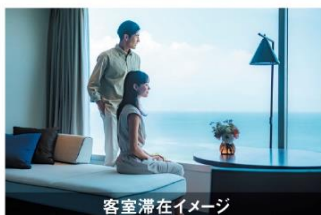
客室滞在イメージ

会員料金 1室2名様利用時/1名様あたり [デラックスルーム] 大人 11,500円 (通常会員料金: 12,500円) [温泉付プレミアールーム] 大人 14,500円 (通常会員料金: 15,500円)